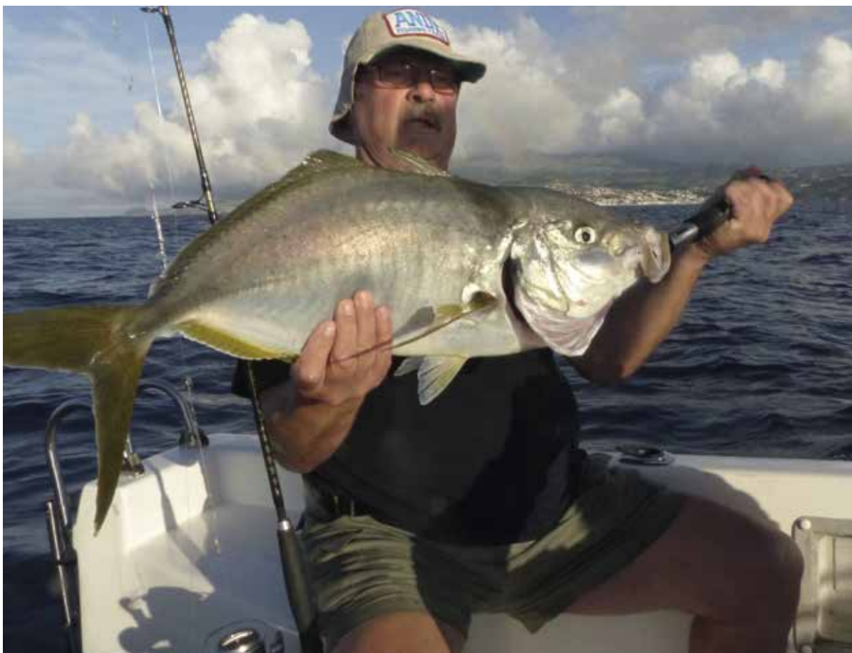
Guelly Jack ( Pseudocaranx dentex ) - 6,58 kg - 92 cm.

kenbare grijze harder nieuw op de lijst. Zie de foto op pagina 40. De andere nieuwe soort betreft een tot de uitgebreide familie van de Jacks behorende Guelly Jack . Deze Pseudocaranx dentex werd op 21 augustus 2015 vanuit Horta (Azoren; Portugal) gevangen door Paulus van den Berk uit St. Oedenrode en is nu opgenomen met het gewicht van 4,60 kilo en een lengte van 75 cm . De recordverbetering in de categorie Europa betrof tenslotte