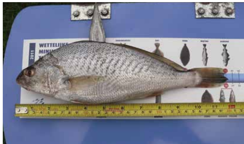
Knorrepos ( Micropogonias undulatus ) - 30,5 cm.