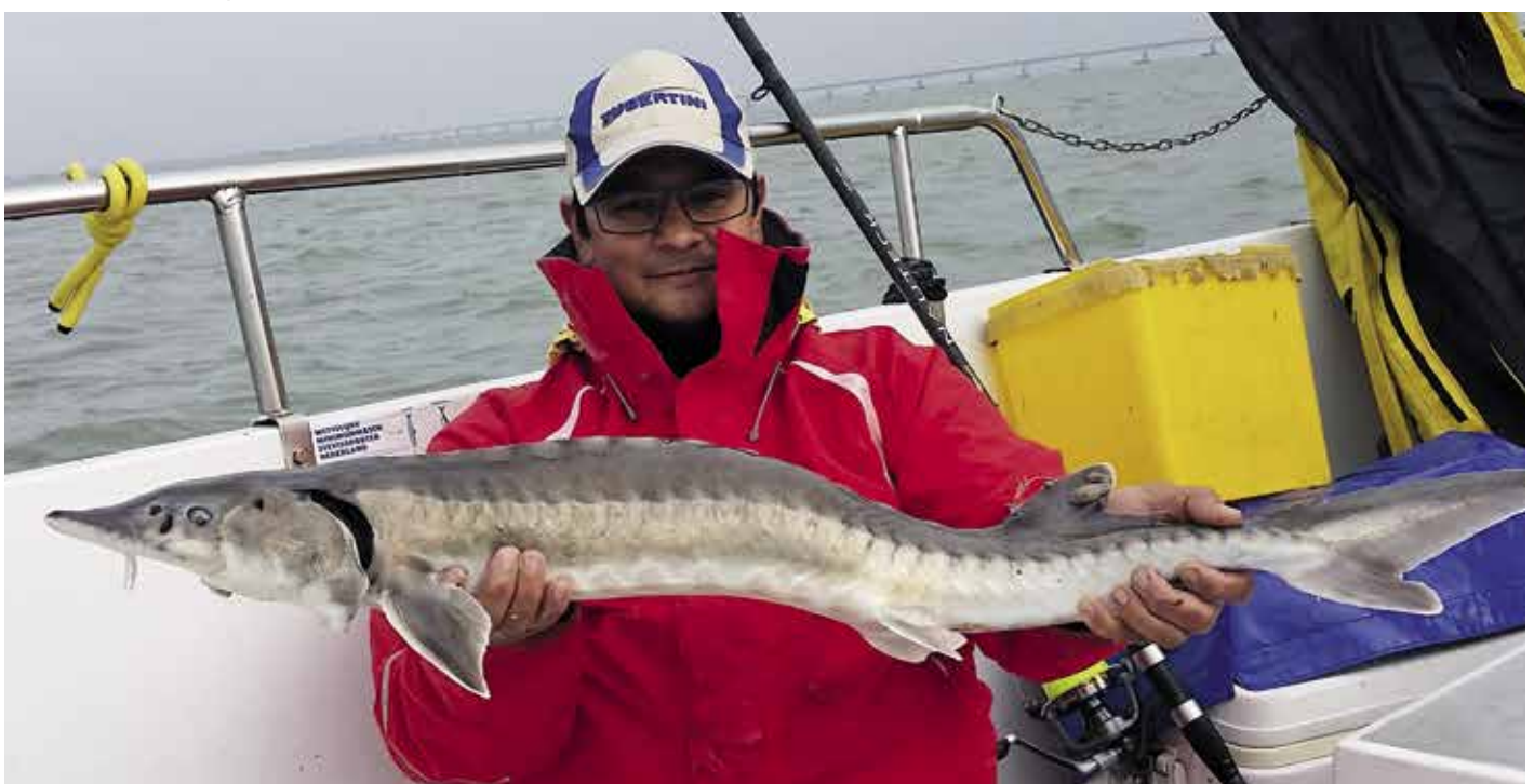
Atlantische Steur ( Acipenser sturio ) – 100 cm.