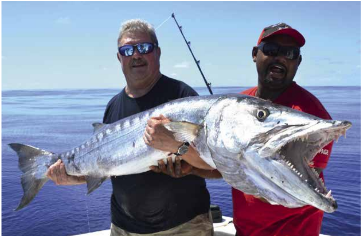
Barracuda ( Sphyaena barracuda ) - 27,54 kg - 163 cm.

een vanuit het Belgische Nieuwpoort gevangen zeebaars ( Dicentrarchus labrax ).