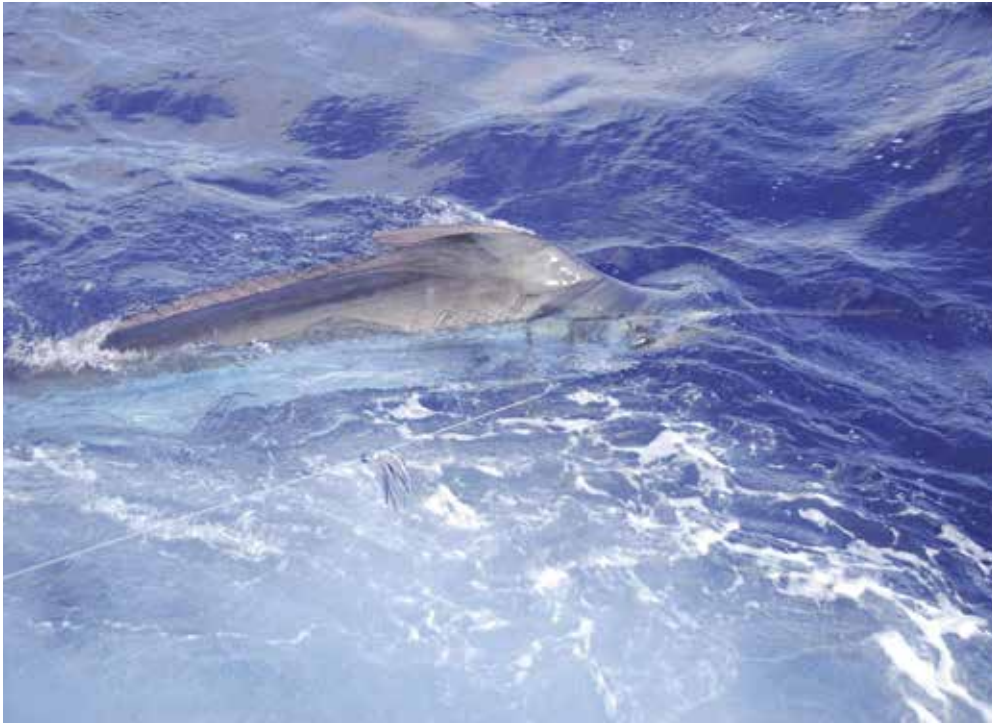
Een Potential Grander (1.000 lb plus) naast de boot, om vervolgens te worden losgelaten.